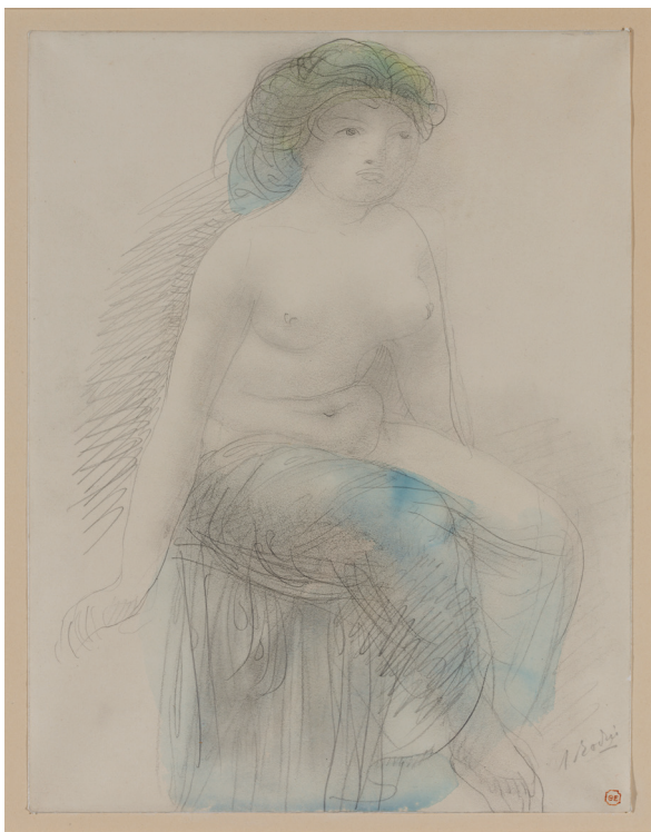
Auguste Rodin (1840-1917) Femme assise, drapée de bleu, vers 1900-1903 Graphite, estompe et aquarelle sur papier vélin H. 32,7 x L. 25 cm Paris, collection privée.