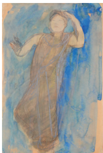
Auguste Rodin (1840-1917) Danseuse cambodgienne, 1906-1907 Graphite, plume et encre brune, lavis d'aquarelle et rehauts de crayon gras sur papier vélin H. 30,8 x L. 20,2 cm. Collection Rodin Operating Foundation.