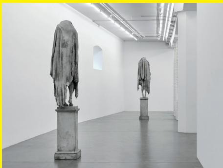
Berlinde De Bruyckere, Arcangelos

De tentoonstelling zet een gedurfde stap richting hedendaagse beeldhouwkunst, in de gedaante van één van de belangrijkste Belgische kunstenaars van haar generatie: Berlinde De Bruyckere, die bekendheid verwierf in 2003 door haar deelname aan de Biennale van Venetië, waar ze België vertegenwoordigde. Haar imposante beeldhouwwerken, zoals de aartsengelen, bieden een nieuwe kijk op het werk van de Franse kunstenaar en verrijken onze perceptie ervan. Zo ontspint zich een ware dialoog tussen het werk van Auguste Rodin en dat van Berlinde De Bruyckere.